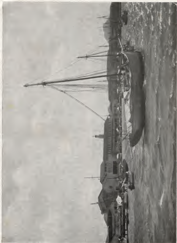
The picturesque Paardenbaai (Horses' Bay) at Aruba.